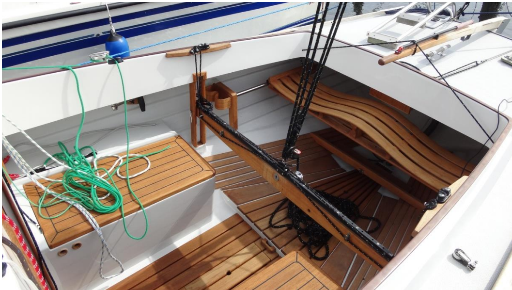
Højdejusterbar skødebro. 4-slået storskøde. Rorripind med fastholdeline. På dækket ses skødeblok til gennakerne. Teaken? Jo båden har sejlet ca. 130 ture siden 2007.

Der er et nyt 4-slået storskøde som er let at udløse i et overraskende vindpust under en sort sky.