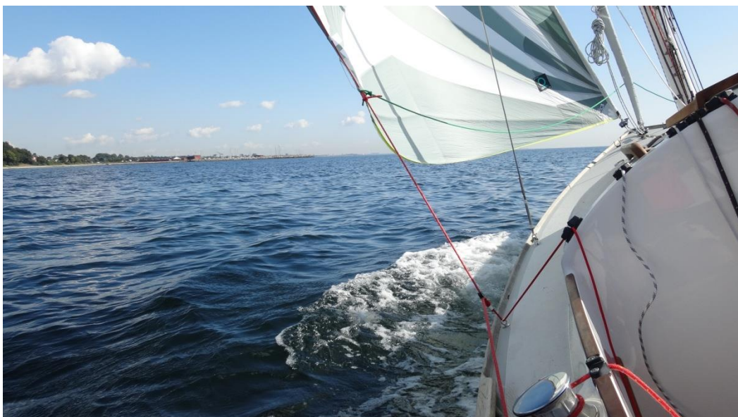
Folkebåd med 40 m2 sejl (23 + 17)

Faldet til gennaker/ Code 0 er af Dyneema og er ført tilbage til cockpit. Nederst på masten er der monteret et frøllår, så man kan sætte / bjærge genaker eller Code 0 singlehanded uden at være cirkusakrobat og uden at skulle holde faldet med munden. Frøllåret er sat således at det udløses nede fra cockpittet når faldet tottes til.