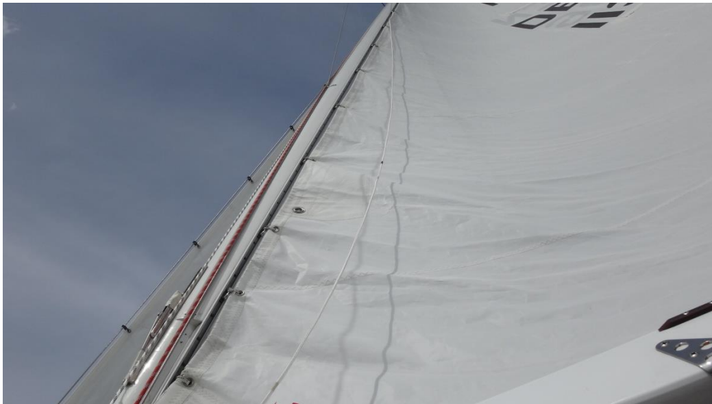
Slæder i en skinne på masten og en nedhalerline

Fra mastetoppen er der ført en fast line ned til enden af bommen så man - via en lille blok og en anden line ført langs bommen og ned til cockpitkanten - kan forhindre bommen i at brager ned når storfaldet udløses.