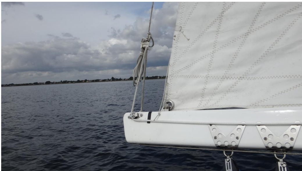
Bomdirk og line ført langs bommen til cockpit

Man kan også i meget let vejr hæve bommen og opnå bedre twist i storsejlet.