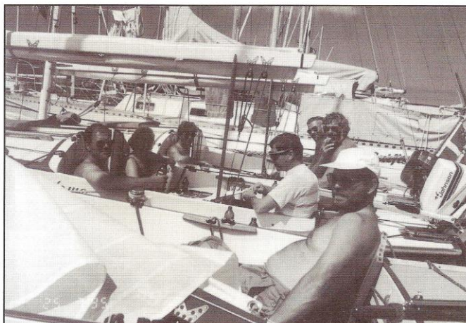
Der er tid til en "kommet i havn" bajer