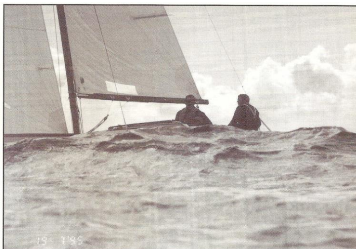
Hjemturen i høj sø