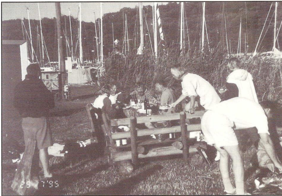
Grillmaden nydes med velbehag.